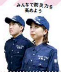
みんなで防災力を高めよう

本市は、今年度を「総合防災訓練」の年と位置付け、さまざまな防災訓練や啓発イベントを行います。イベントをきっかけに防災意識を高めましょう。 ▷問合せ 危機管理課(内線3110) 詳しくはこちら